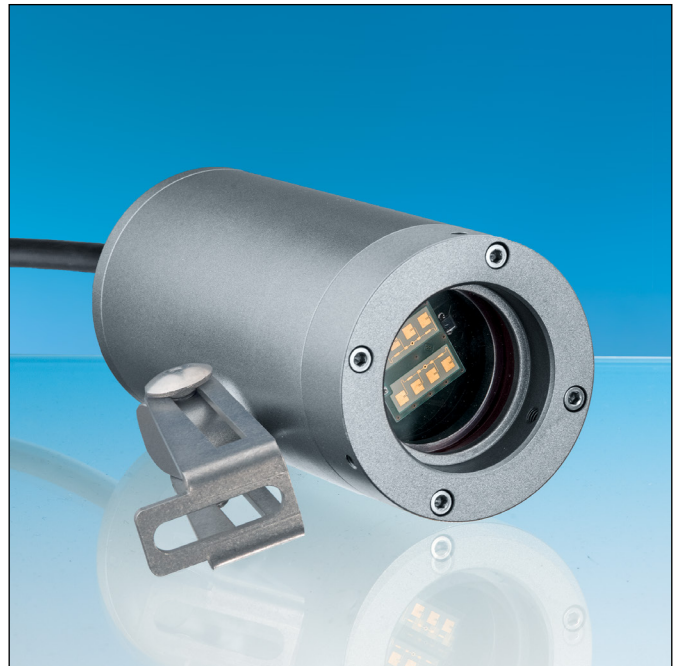
Lumiglas Meldegerät M55-BD-Ex