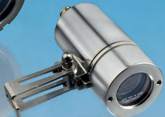
Lumiglas-VISULEX-Ex-Kamera mit Zoom-Objektiv Typ K 25-Ex, Edelstahl