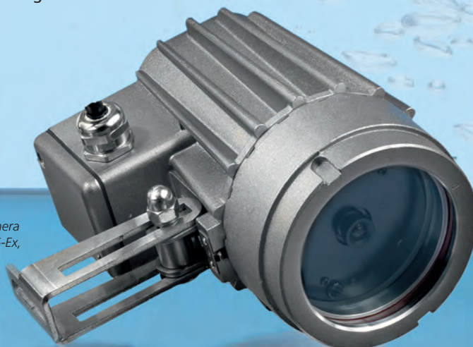
Lumiglas-VISULEX-Ex-Kamera mit Festobjektiv, Typ K 06-Ex, Aluminium

Projektspezifisch bietet Lumiglas je nach vorhandenem technischen Potenzial des Anlagenbetreibers den kompletten Service wie Installation, Inbetriebnahme, PC-Vernetzung inklusive aller notwendigen Komponenten. Die Abwicklung erfolgt in diesem Fall als individuell kalkuliertes Projekt. Ein Pflichtenheft wird auf Basis einer Checkliste erarbeitet.