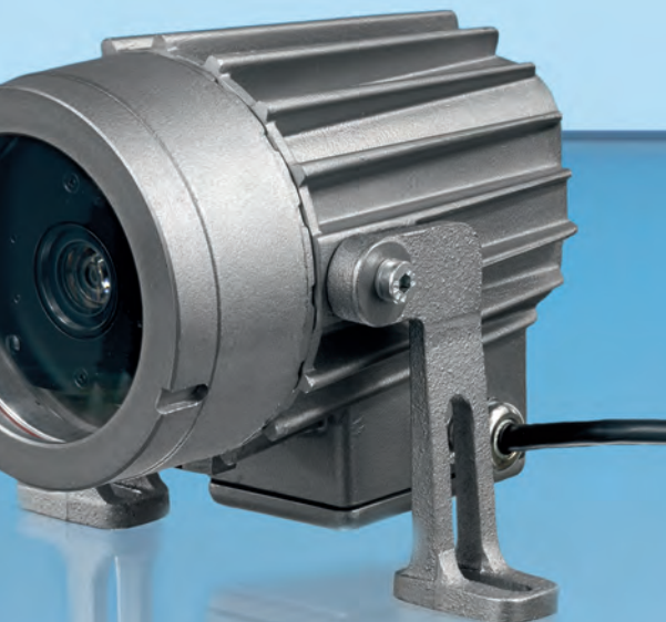
Lumiglas-VISULEX-Ex-Kamera mit Zoom-Objektiv Typ K 07-Ex, Aluminium