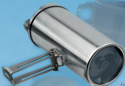
Lumiglas-VISULEX-Kamera (Nicht-Ex) mit Festobjektiv, Typ K 15, Edelstahl