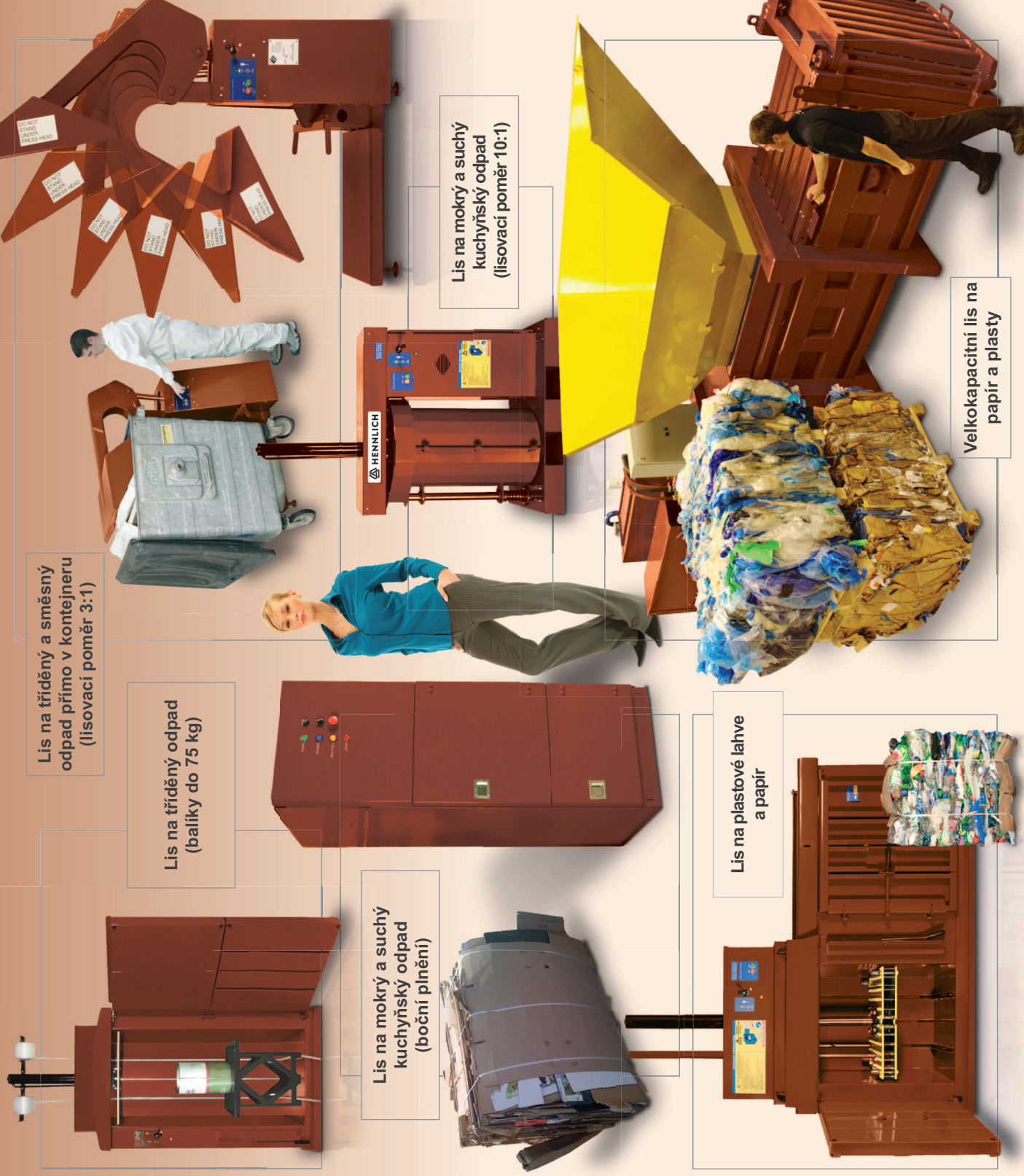
Lis na tříděný a směsný odpad přímo v kontejneru (lisovací poměr 3:1)