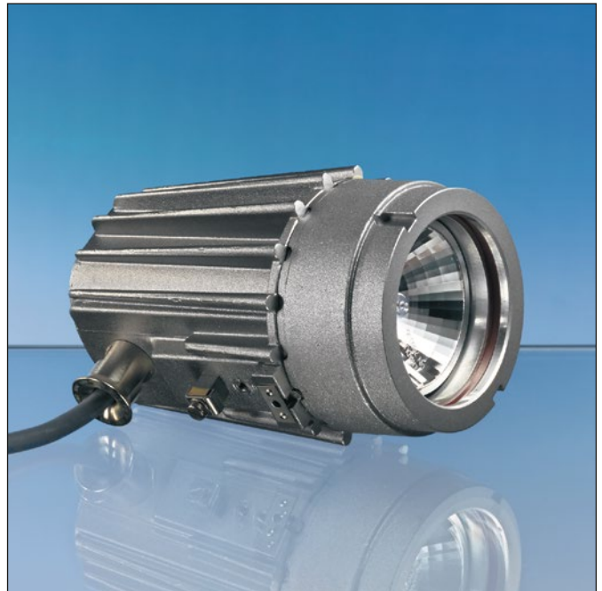
Lumistar Leuchte USL 06