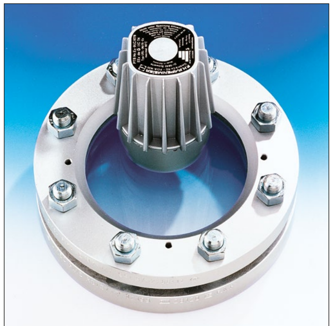
Einsatz als Kombination von Sicht- und Lichtglas auf einer Schauglas-Armatur nach DIN 28120, Montage über Klappscharnier