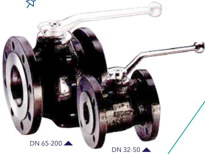
DN 65-200 ▲